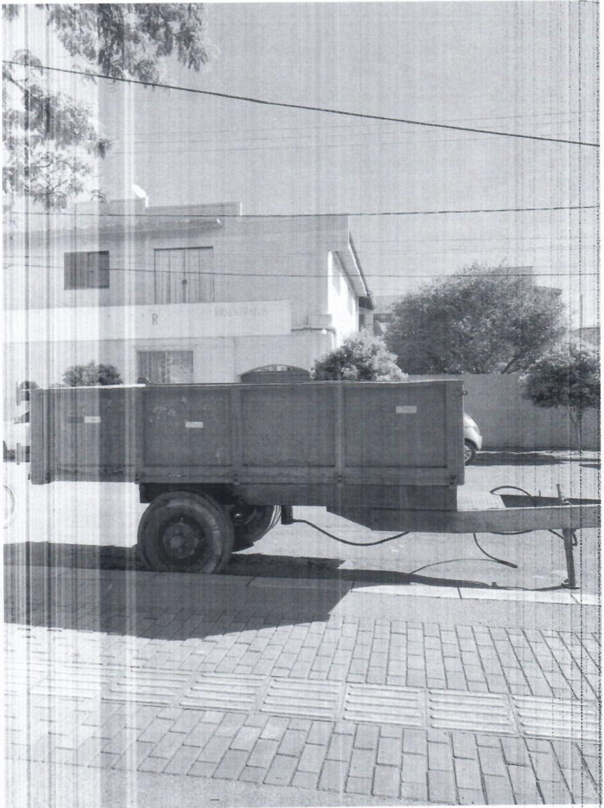
Foto 4: Carretinha onde armazenamos os resíduos durante a coleta na praça central.