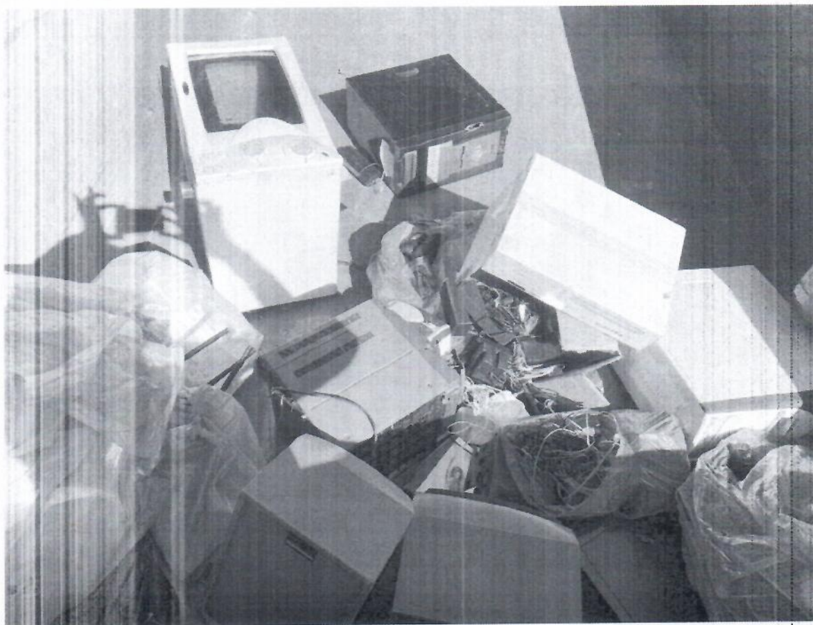
Foto 5: Resíduos que foram descartados pela população durante a ação.